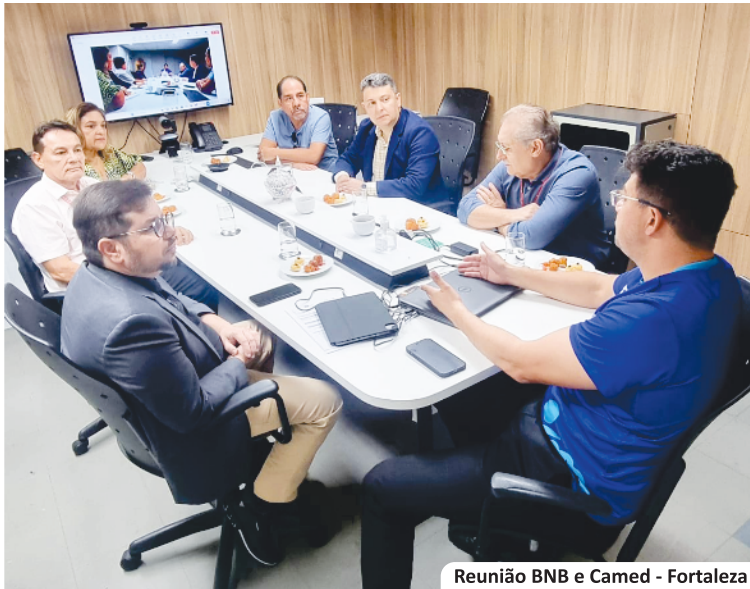
Reunião BNB e Camed - Fortaleza