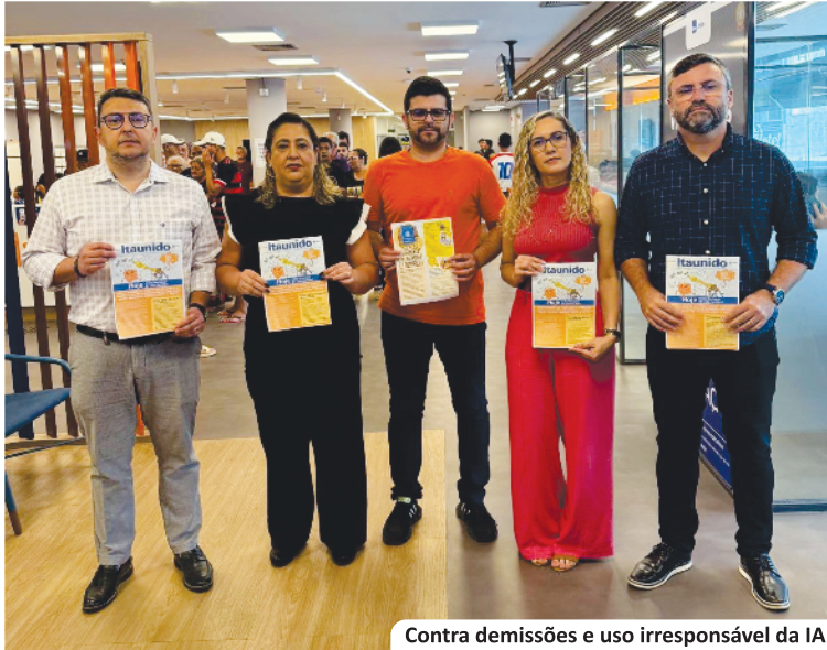
Contra demissões e uso irresponsável da IA