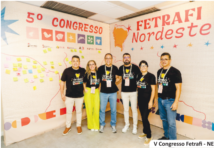
V Congresso Fetrafi - NE