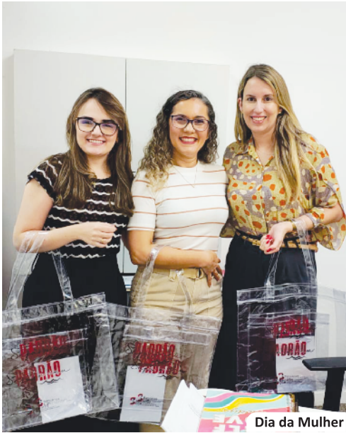
Dia da Mulher