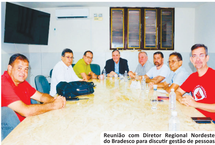
Reunião com Diretor Regional Nordeste do Bradesco para discutir gestão de pessoas