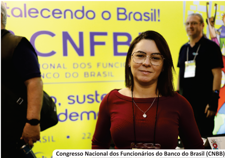
Congresso Nacional dos Funcionários do Banco do Brasil (CNBB)