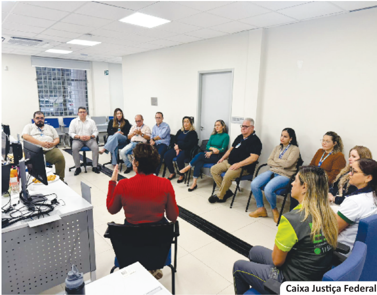
Caixa Justiça Federal