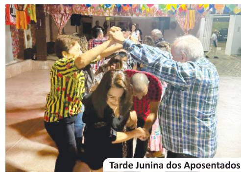
Tarde Junina dos Aposentados