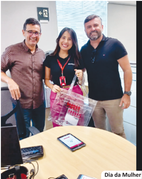
Dia da Mulher