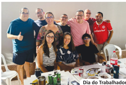
Dia do Trabalhador