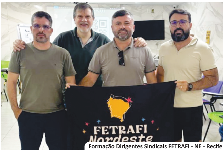
Formação Dirigentes Sindicais FETRAFI - NE - Recife