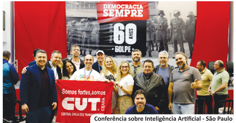
Conferência sobre Inteligência Artificial - São Paulo