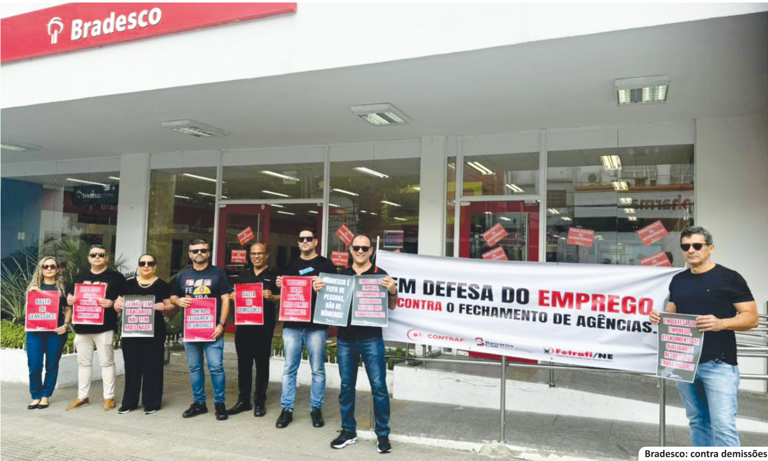
Bradesco: contra demissões