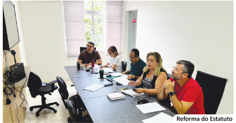
Reforma do Estatuto