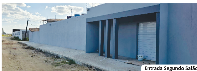
Entrada Segundo Salão