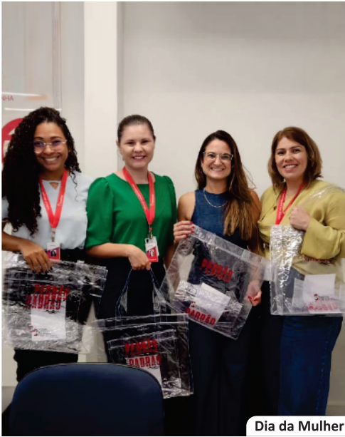
Dia da Mulher