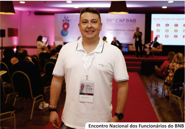
Encontro Nacional dos Funcionários do BNB