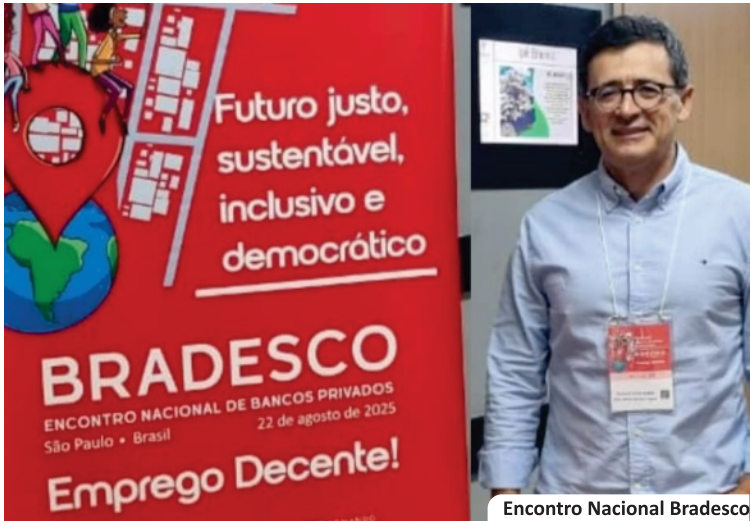
Encontro Nacional Bradesco