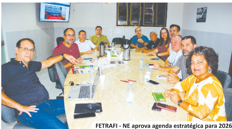
FETRAFI - NE aprova agenda estratégica para 2026