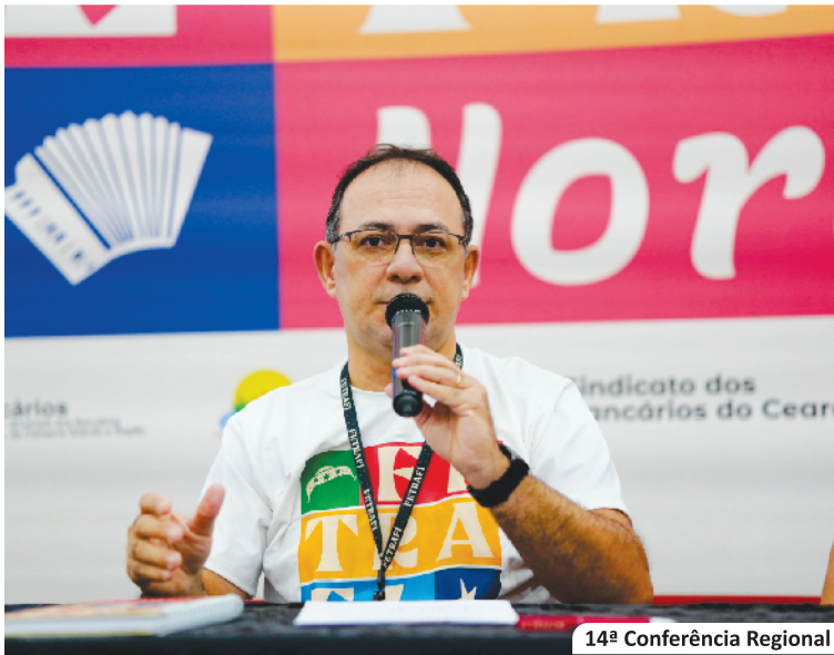
14ª Conferência Regional

E m 2025, mesmo sem a Campanha Nacional para renovação da CCT, o Sindicato marcou presença nos principais fóruns de debate da categoria — assembleias, encontros, congressos e conferências em todo o país. Em cada espaço, levou a voz da base, contribuindo para análises e deliberações estratégicas diante dos desafios atuais e das transformações do setor financeiro.