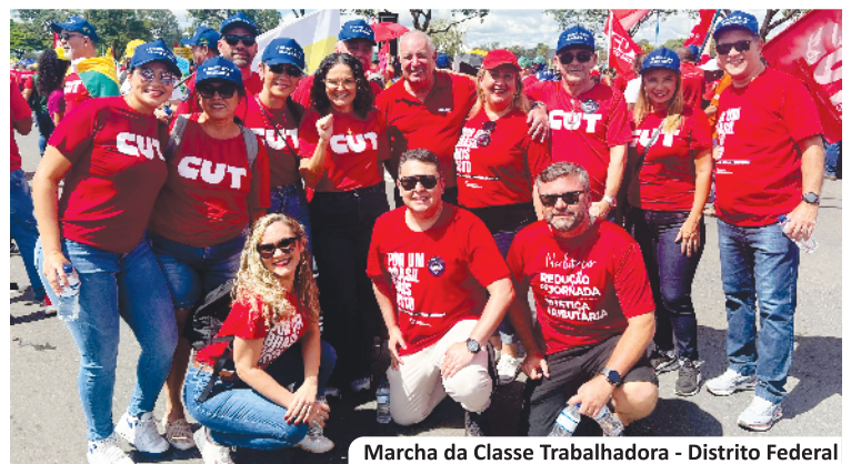
Marcha da Classe Trabalhadora - Distrito Federal