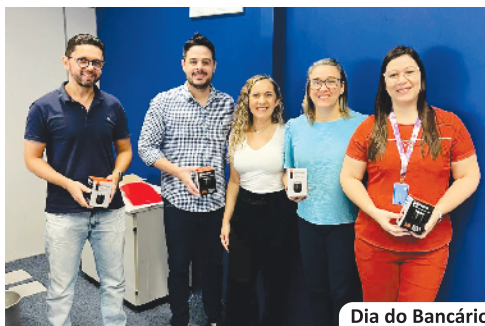
Dia do Bancário