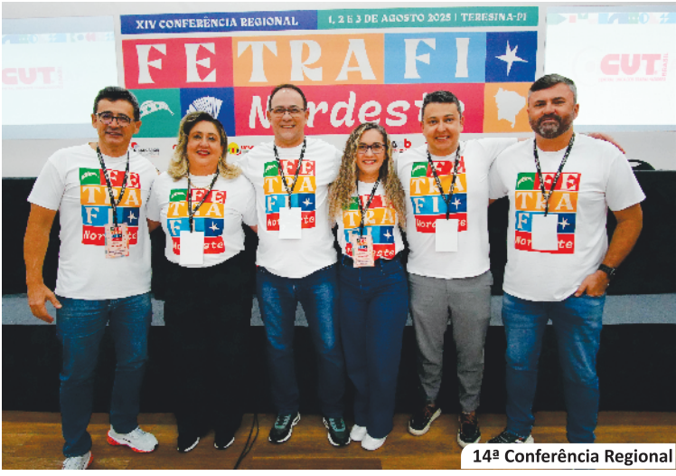
14ª Conferência Regional