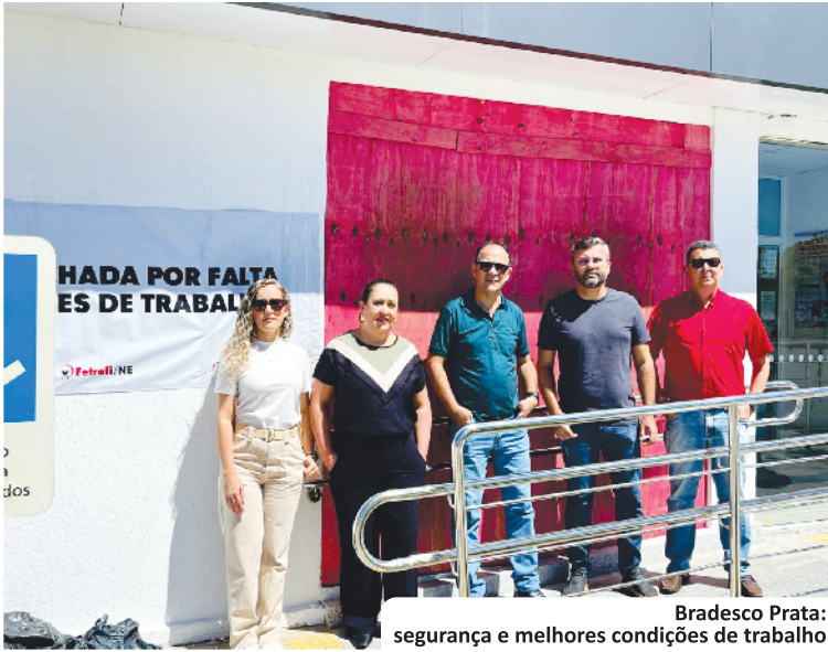
Bradesco Prata: segurança e melhores condições de trabalho