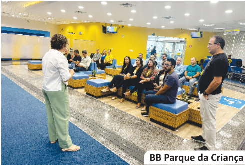
BB Parque da Criança