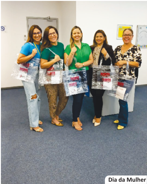
Dia da Mulher

calendário de eventos deste ano, com integração, cultura e valorização de quem faz a luta acontecer todos os dias.