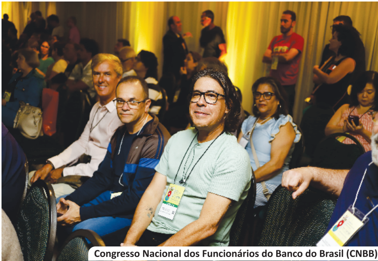
Congresso Nacional dos Funcionários do Banco do Brasil (CNBB)