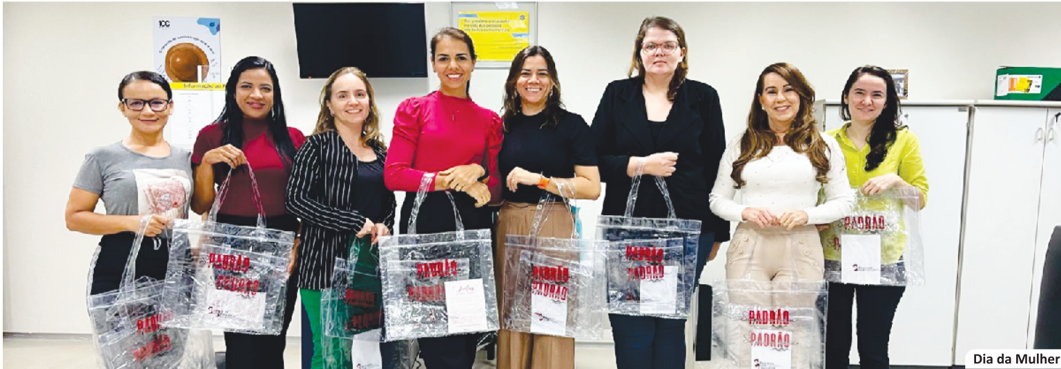
Dia da Mulher