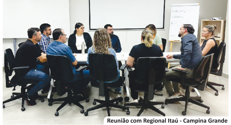
Reunião com Regional Itaú - Campina Grande