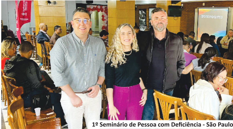
1º Seminário de Pessoa com Deficiência - São Paulo