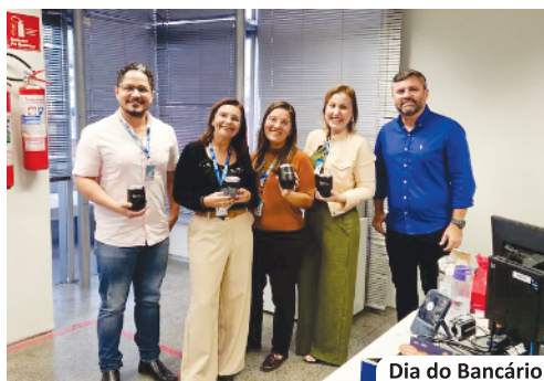
Dia do Bancário