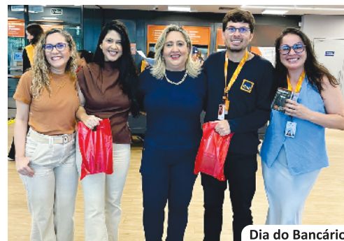
Dia do Bancário