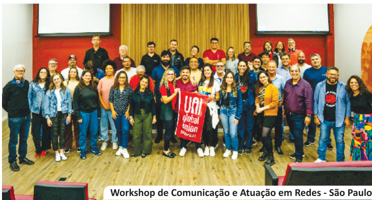
Workshop de Comunicação e Atuação em Redes - São Paulo