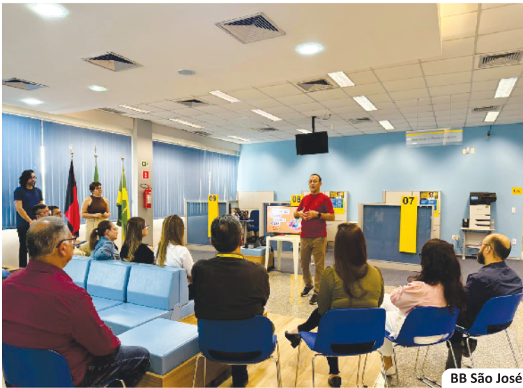
BB São José