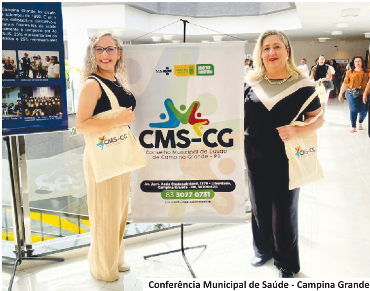
Conferência Municipal de Saúde - Campina Grande

Os representantes dos trabalhadores tiveram participação ativa em atos públicos, encontros, formações e eventos em defesa da classe trabalhadora, reafirmando nossas pautas, direitos e a força da mobilização coletiva.