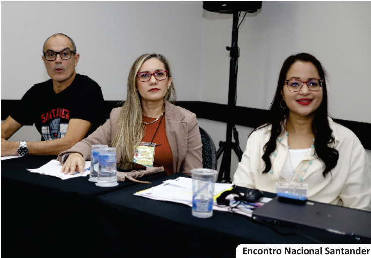
Encontro Nacional Santander