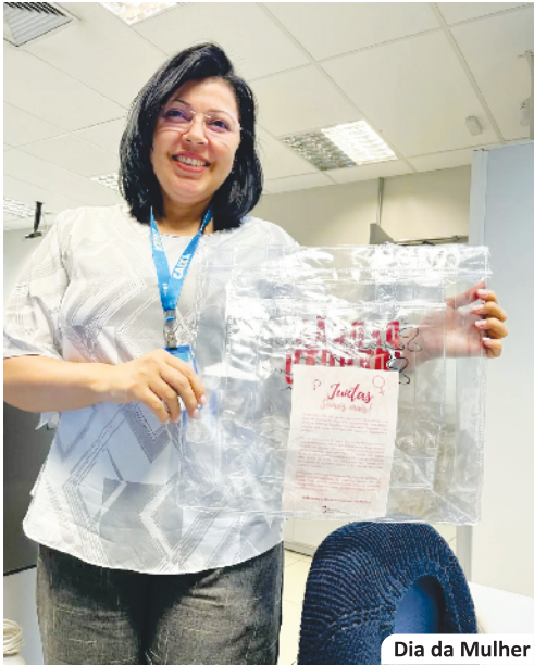
Dia da Mulher