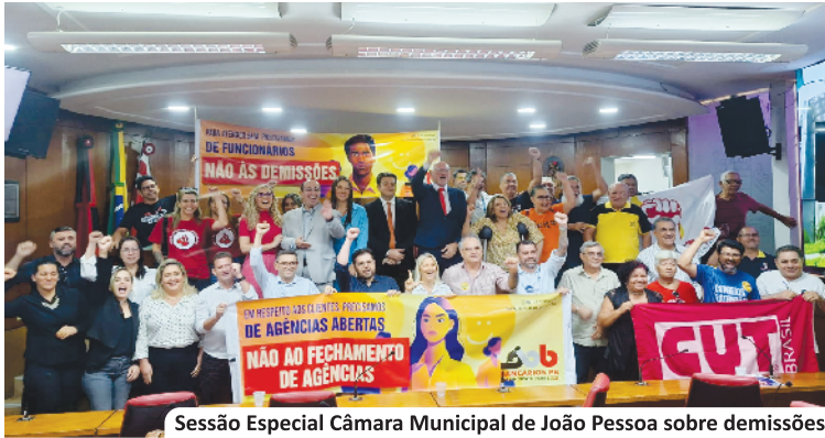
Sessão Especial Câmara Municipal de João Pessoa sobre demissões