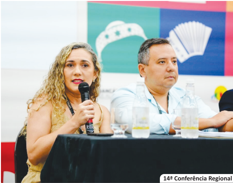
14ª Conferência Regional