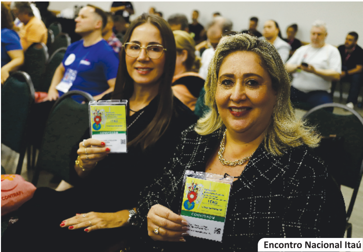
Encontro Nacional Itaú