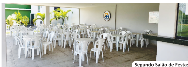
Segundo Salão de Festas