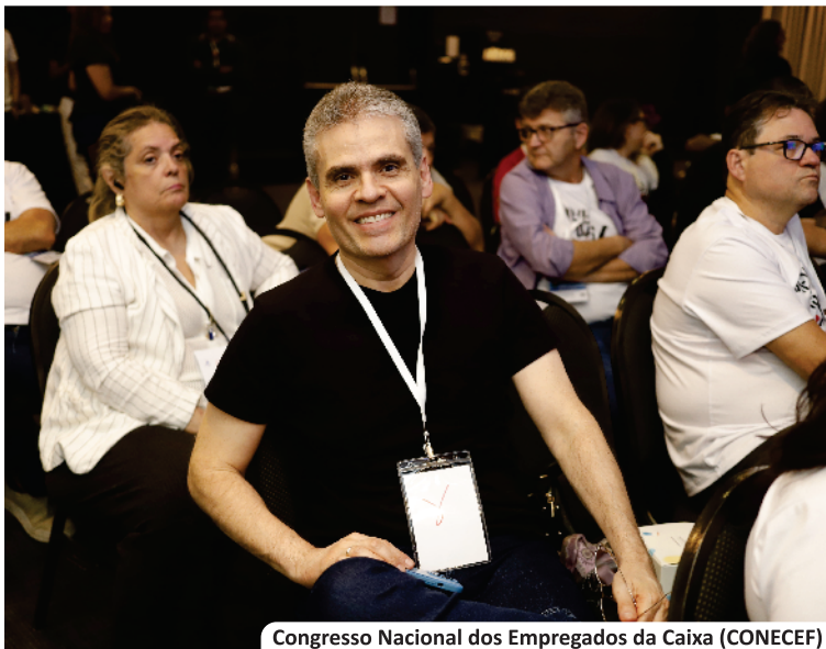
Congresso Nacional dos Empregados da Caixa (CONECEF)