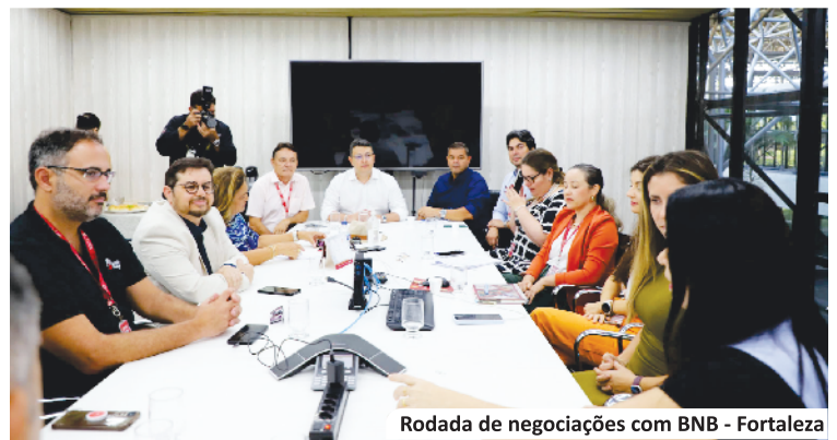
Rodada de negociações com BNB - Fortaleza