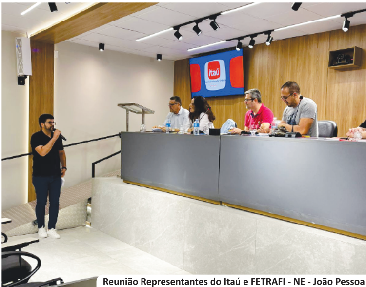
Reunião Representantes do Itaú e FETRAFI - NE - João Pessoa