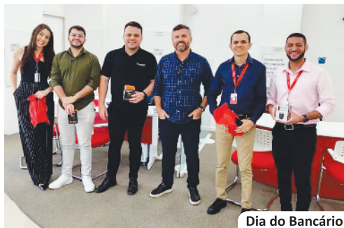
Dia do Bancário