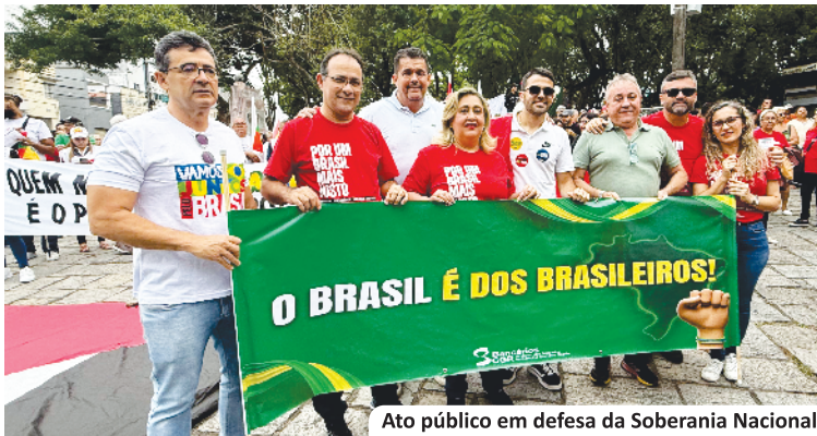
Ato público em defesa da Soberania Nacional