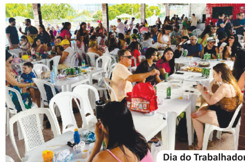
Dia do Trabalhador