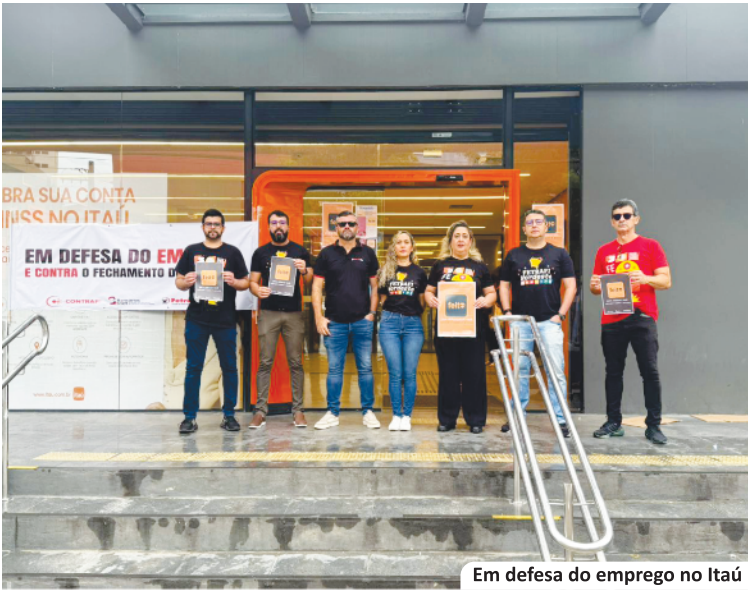
Em defesa do emprego no Itaú