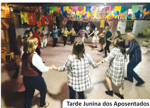
Tarde Junina dos Aposentados