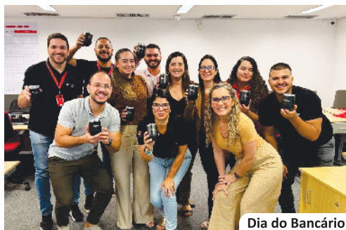
Dia do Bancário