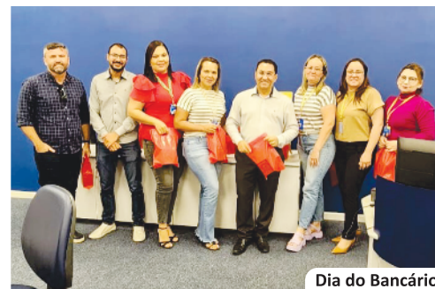
Dia do Bancário