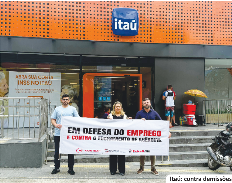
Itaú: contra demissões