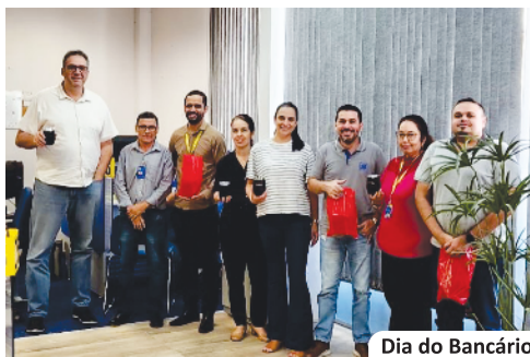
Dia do Bancário