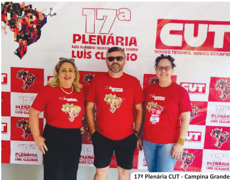
17ª Plenária CUT - Campina Grande