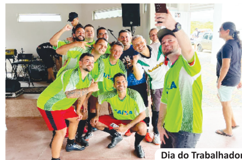
Dia do Trabalhador