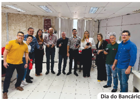
Dia do Bancário