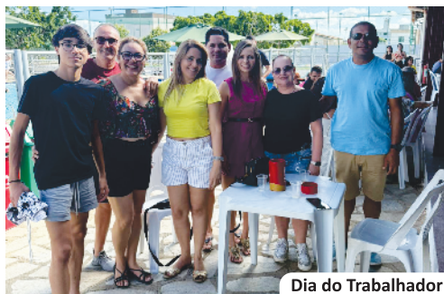
Dia do Trabalhador