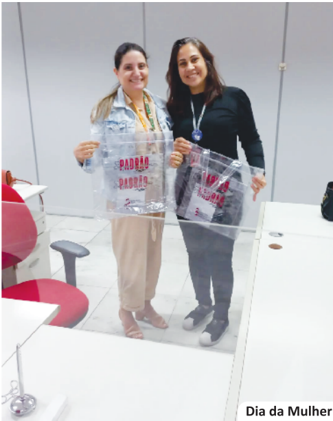
Dia da Mulher